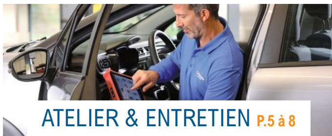
ATELIER & ENTRETIEN P.5 à 8