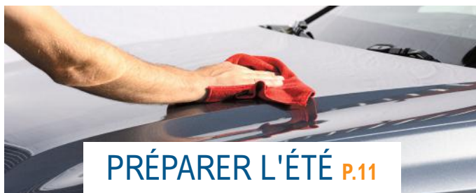
PRÉPARER L'ÉTÉ P.11