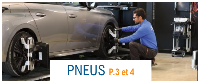
PNEUS P.3 et 4