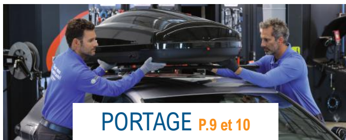
PORTAGE P.9 et 10